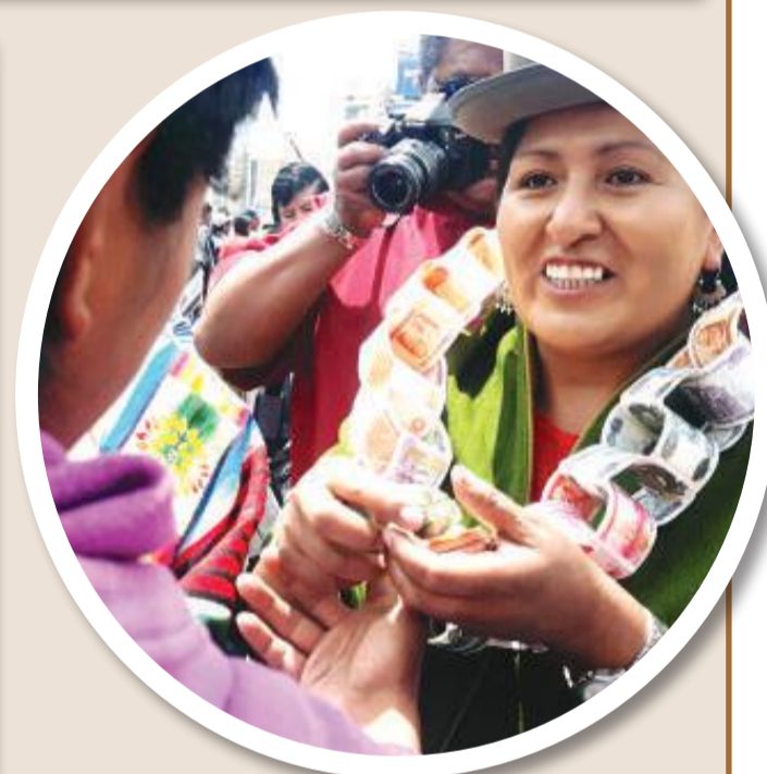
El ritual también incluyó el intercambio o trueque.