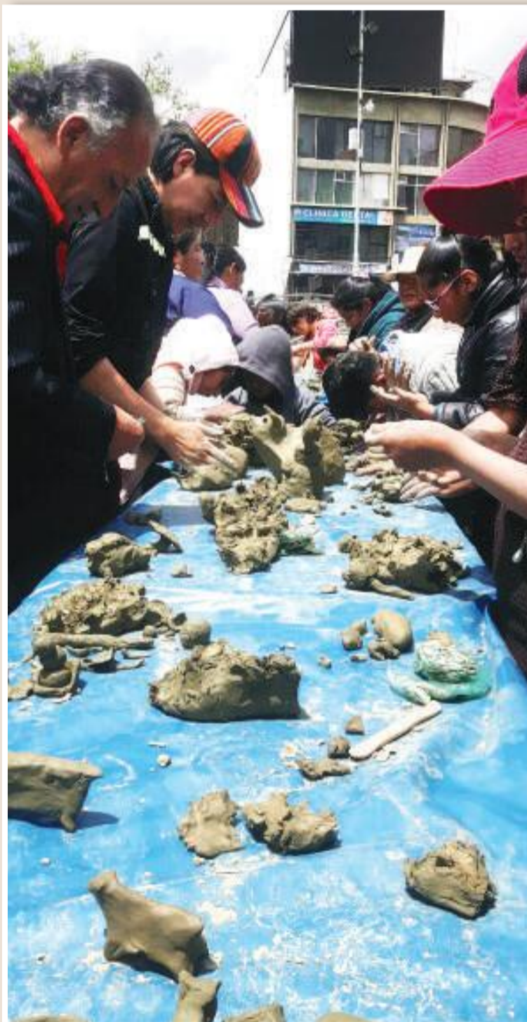
Los asistentes al ritual de la illa elaboraron en arcilla sus anhelos.

“El equilibrio entendiendo que todo suceso de la naturaleza no es un hecho aislado, sino producto de una interacción del conjunto. Por lo tanto en el mundo andino las autoridades de las comunidades convocan a la toda la comunidad para revisar y reflexionar sobre las causas que pudiesen haber generado tales desequilibrios y a través de las ceremonias; reconstituir la armonía y el equilibrio y reencausar las acciones generadoras de vida junto con las illas e ispullas”.