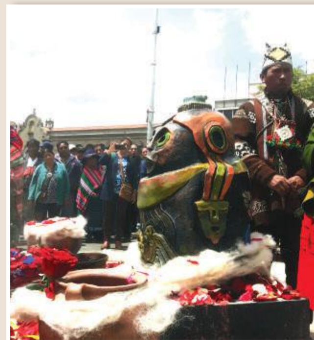
Representación de la illa que fue repatriada en 2014.