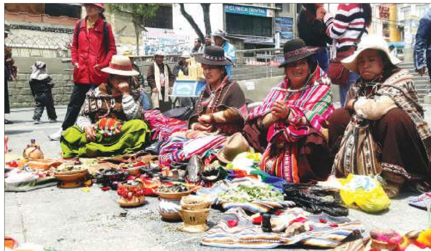
Los saberes y conocimientos y el equilibrio con la naturaleza se mostraron en la ofrenda.

El jaqi illa es la fuente de la unión sagrada: la pareja, el chacha illa es la fuente del varón y la warmi illa que es la fuente de la mujer son parte del Illapacha el tiempo/espacio de los anhelos. Somos los grandes “agircultores” de las “cosechas” de nuestras propias vidas.