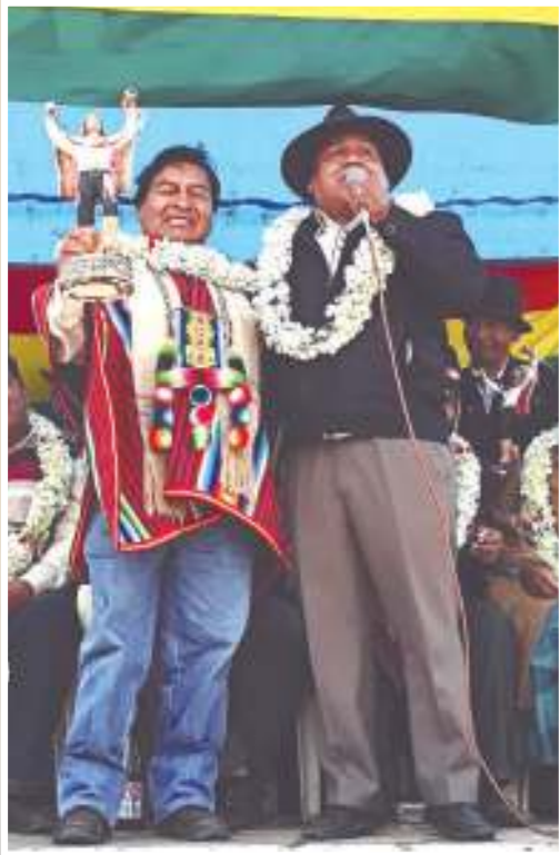
El Viceministro de Descolonización junto con el Alcalde de Ayo Ayo

Un himno puede estar dedicado a dioses, un santo, una persona célebre o para celebrar una victoria, otro suceso memorable de una nación, también puede expresar júbilo o entusiasmo en cuyo caso es llamado oda. Pero al tratarse del Himno Nacional de Tupaj Katari estará dedicado a la lucha y el compromiso revolucionario del héroe indígena que junto con Bartolina Sisa encendieron la insurgencia y la guerra indígena con una gran movilización que se expandió en Oruro, en Cochabamba, Salta y Tucumán (en el norte de Argentina), llegando incluso a Arica (norte de Chile)