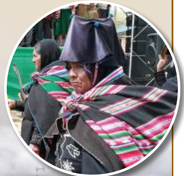
Una autoridad de Sullcavi luce su vestimenta originaria