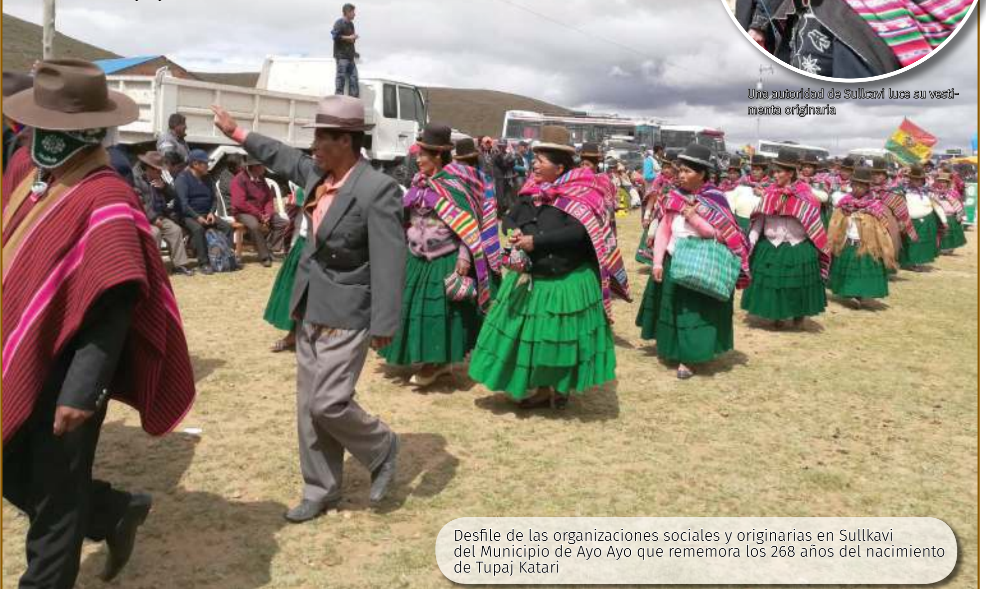
Desfile de las organizaciones sociales y originarias en Sullcavi del Municipio de Ayo Ayo que rememora los 268 años del nacimiento de Tupaj Katari