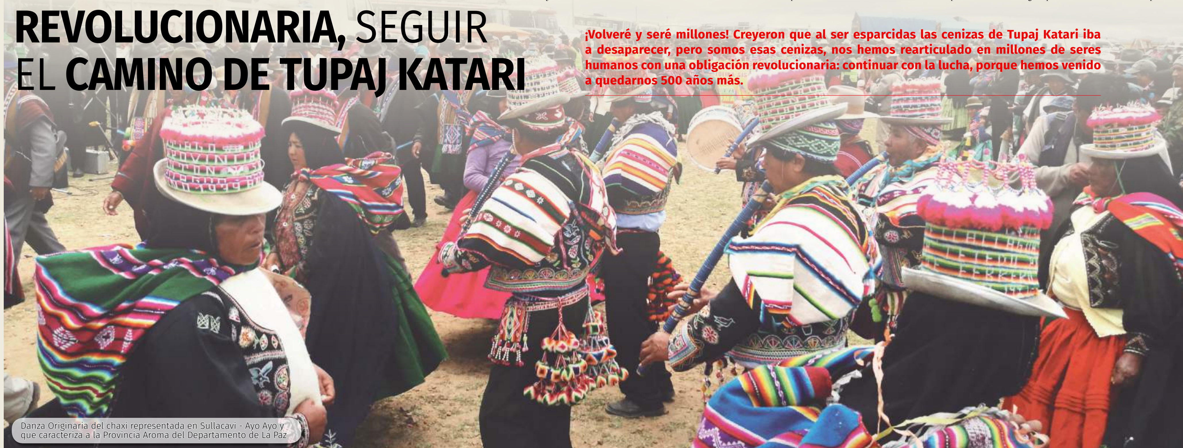
Danza Originaria del chaxi representada en Sullcavi - Ayo Ayo y que caracteriza a la Provincia Aroma del Departamento de La Paz

¡Volveré y seré millones! Creyeron que al ser esparcidas las cenizas de Tupaj Katari iba a desaparecer, pero somos esas cenizas, nos hemos rearticulado en millones de seres humanos con una obligación revolucionaria: continuar con la lucha, porque hemos venido a quedarnos 500 años más.