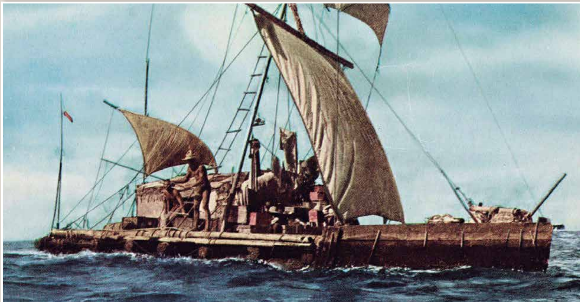
La embarcación Kon Tiki de Heyerdahl que a mediados del siglo pasado evidenció las rutas comerciales de hace más de tres mil años.

Los expedicionarios comprobaron en sus largas travesías las exitosas navegaciones prehispánicas con barcos construidos de materia prima natural del Abya Yala, lo que demuestra el contacto intercultural que existió entre los pueblos.