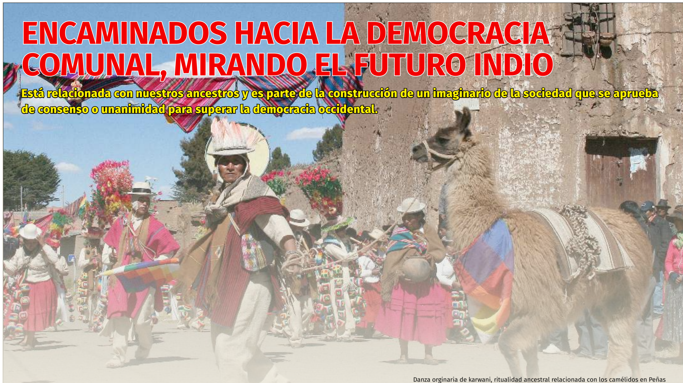
Danza originaria de karwani, ritualidad ancestral relacionada con los camélidos en Peñas

Está relacionada con nuestros ancestros y es parte de la construcción de un imaginario de la sociedad que se aprueba de consenso o unanimidad para superar la democracia occidental.