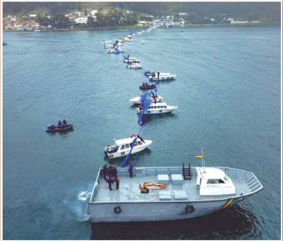
Una de las banderas de la reivindicación que fue extendida en el estrecho de Tiquina.

La Paz quiere que ese tribunal obligue a Chile a negociar una salida soberana al océano Pacífico. “Bolivia pretende abrir la puerta que Chile la cerró hace años”.