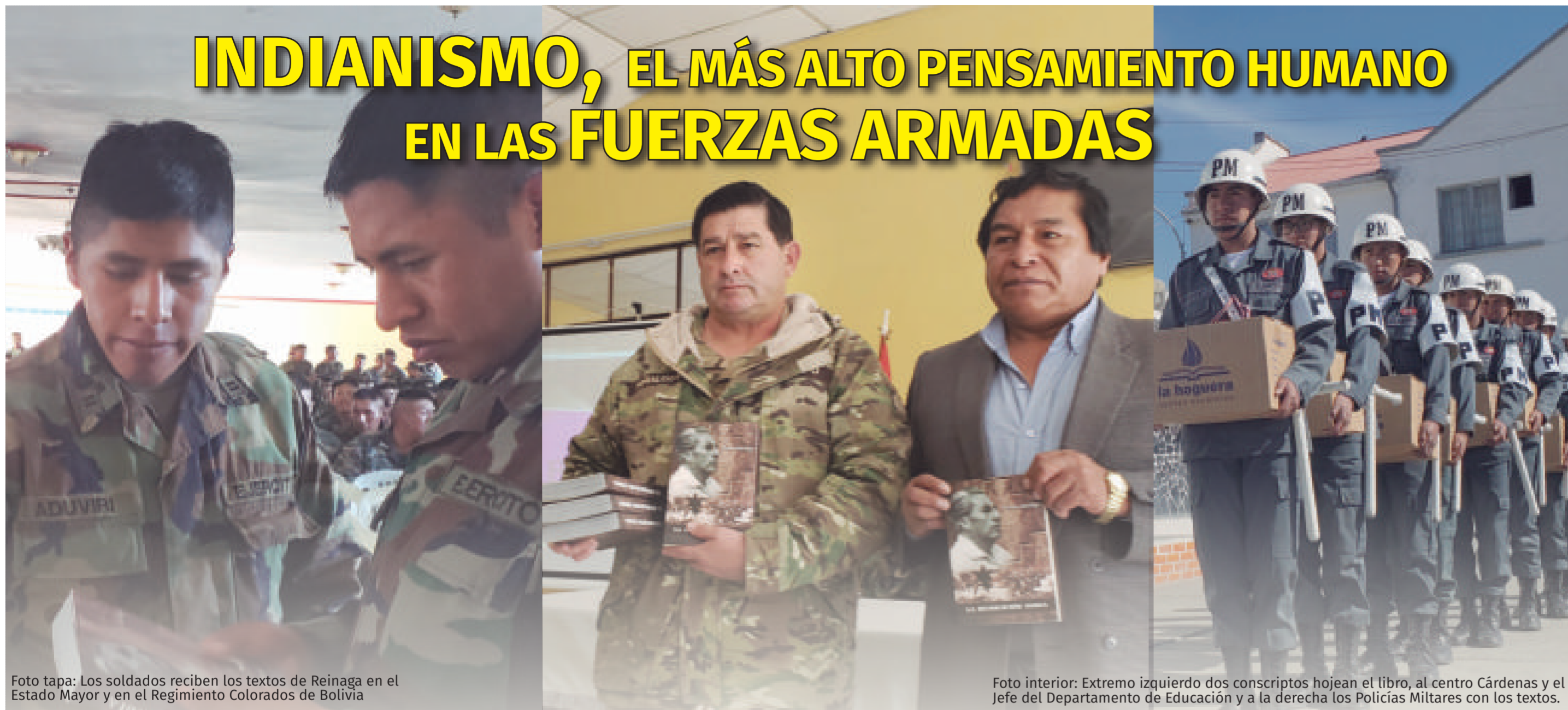
Foto tapa: Los soldados reciben los textos de Reinaga en el Estado Mayor y en el Regimiento Colorados de Bolivia