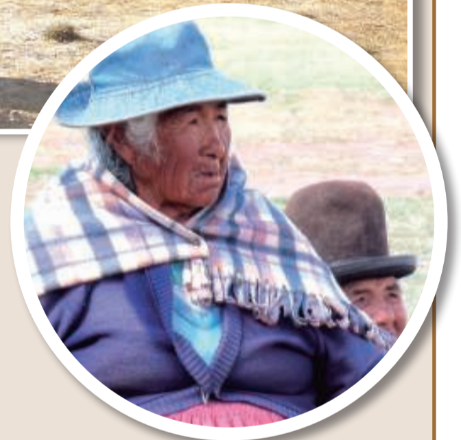
Una anciana aymara de Peñas que transmite a las nuevas generaciones la lucha libertadora de los indios.