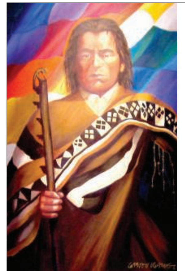
Julián Apaza, el revolucionario Tupaj Katari que fue descuartizado en Peñas.

Desde febrero de 1781 Julián Apaza (Tupaj Katari) y Bartolina Sisa –el chacha/warmi en la cosmovisión andina milenaria es la dualidad hombre/mujer– comandan la rebelión en La Paz