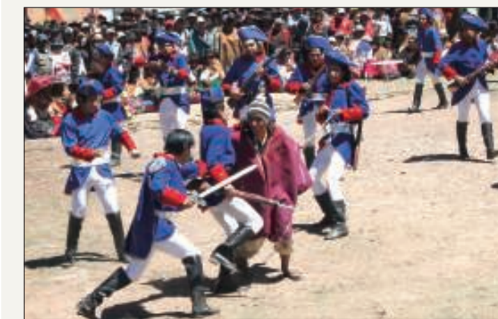
Escenificación de la rebelión de Tupaj Katari también en Peñas.