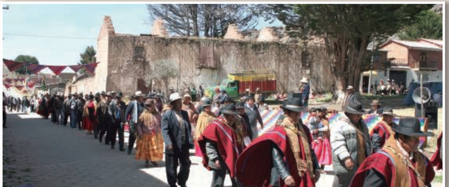
La Casa de la Sentencia al fondo que es restaurada y los dirigentes desfilan rememorando la gran insurrección indígena.