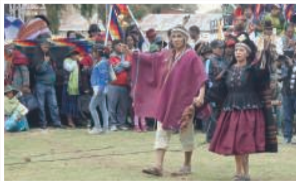
Las hazañas de Tupaj Katari y Bartolina Sisa son representadas por actores del consagrado grupo Albor.

¡Naya saparukiw jawayapxitäta, ukxarusti waranq waranqanakaw kutt'anipxä! ¡A mí sólo me están matando, después de mí millones volveremos!