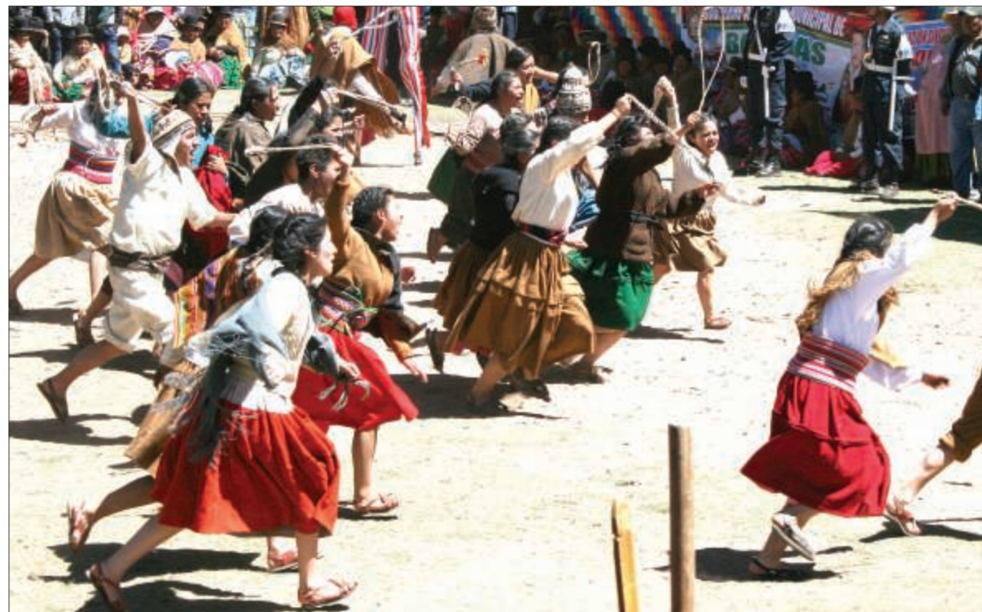
Una escena de la obra “Tupaj Katari” del grupo Albor presentada en Peñas.

Mucha documentación existente de la época, se refiere a los “bravos”, “valientes” y “aguerridos” indios de Sica Sica. En una carta –según la obra “Indígenas en Política” de Pilar Mendieta– fechada el 9 de julio de 1781, es decir en pleno conflicto, una de las autoridades españolas hace referencia al carácter de los indios (...) y recono-