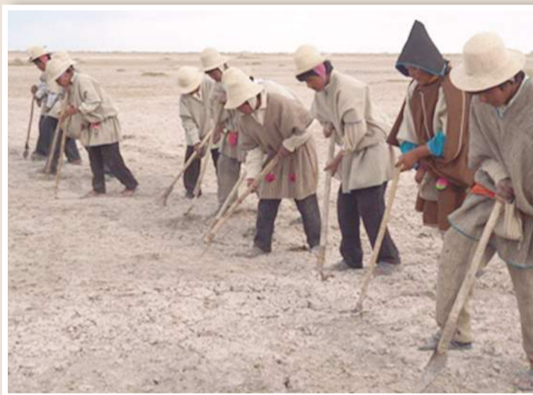
Los uru establecieron el ayllu antes que los aymaras y quechuas

Los Curacas de Chucuito, el corregidor de Pacajes y casi toda la Audiencia de Charcas se unieron contra los urus rebeldes, pero sin éxito alguno.