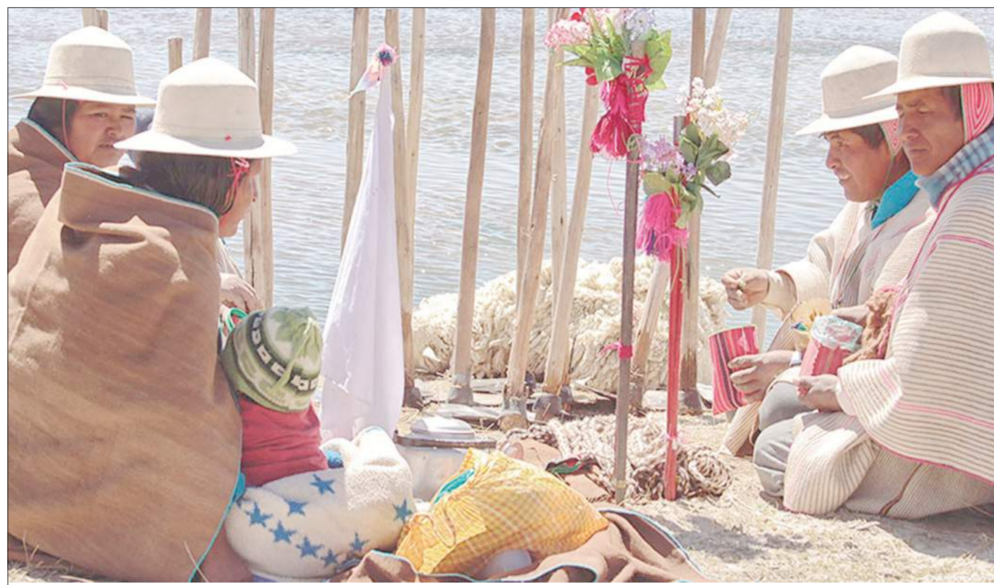
La cultura que surgió antes que los aymaras y quechuas conserva aún su ritualidad.

La Ley N° 450 también tiene por objeto establecer los mecanismos y políticas sectoriales e intersectoriales de prevención, protección y fortalecimiento, para salvaguardar los sistemas y formas de vida individual y colectiva, de las naciones y pueblos indígena originarios en situación de alta vulnerabilidad, cuya supervivencia física y cultural esté extremadamente amenazada y en riesgo de desaparecer.