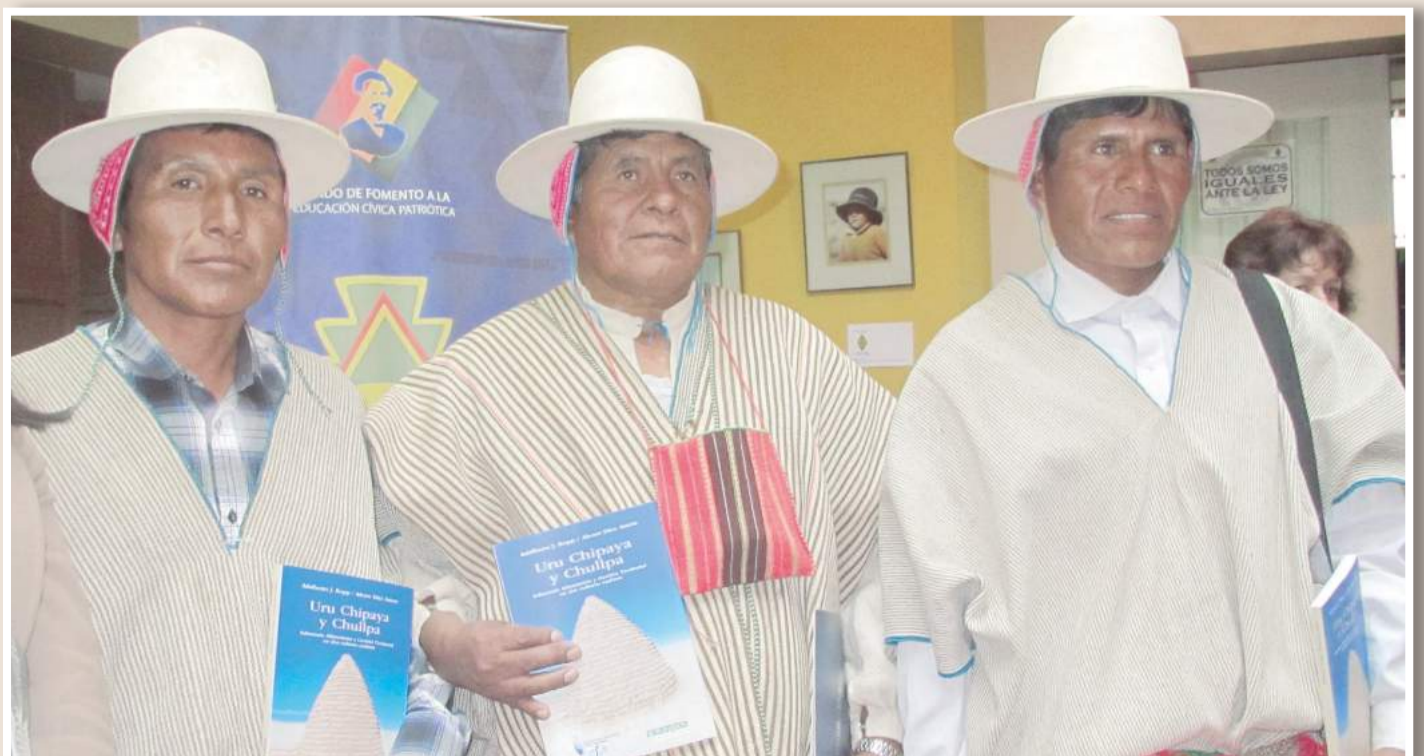
Representantes de la Nación Originaria Uru que participaron del conversatorio sobre sus saberes y conocimientos.