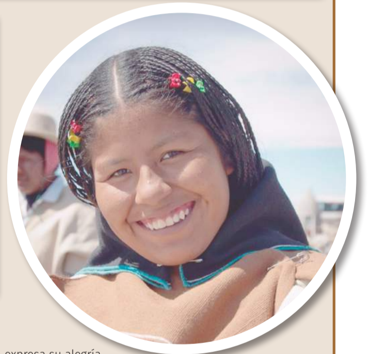
Una mujer de la cultura milenaria expresa su alegría